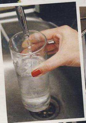
Dodržování pitného režimu je hlavně v létě nezbytné.