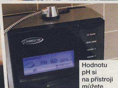
Hodnotu pH si na přístroji můžete zvolit sami.